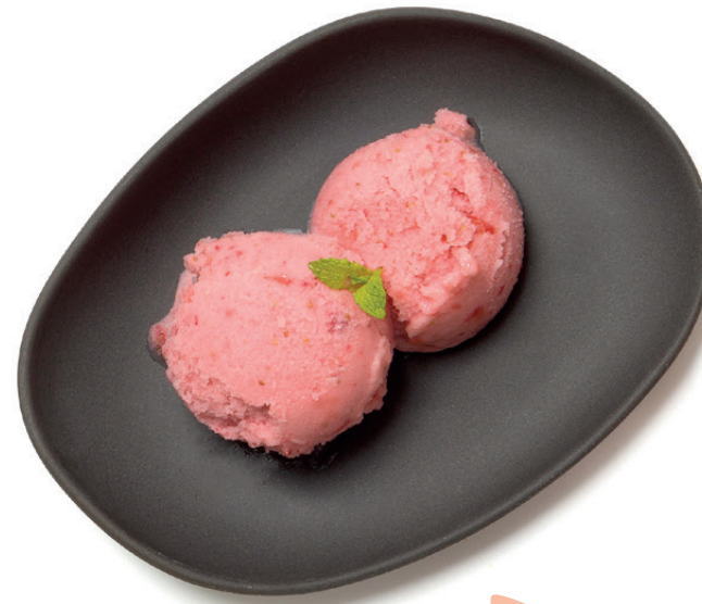
Helado (2 u.)

Triturar 250g de fruta congelada con 1 yogur natural desnatado y 25ml de leche desnatada hasta obtener una crema helada. Servir de inmediato.