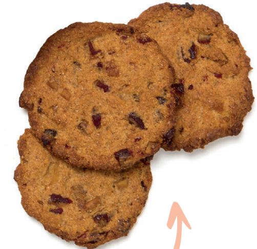
Galletas (3 u.)

Mezclar 120g de harina integral y 2,5g de levadura química, añadir 60g de clara de huevo, 25ml de leche desnatada y 60g de dátiles picados, formar galletas de 20g cada una y hornear a 160°C durante 25'.