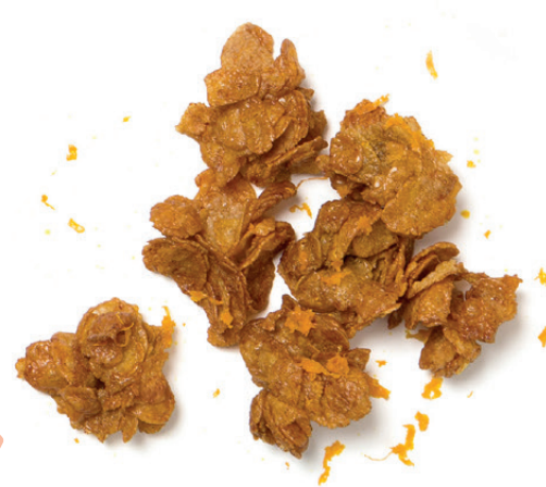
Rocas crujientes (6 u.)

Mezclar 200 g de copos de maíz con 100 g de clara de huevo, canela, ralladura de naranja y una pizca de sal, dejar reposar 5', formar bolitas de unos 5 g y hornear a 150°C durante 15' con modo ventilador.