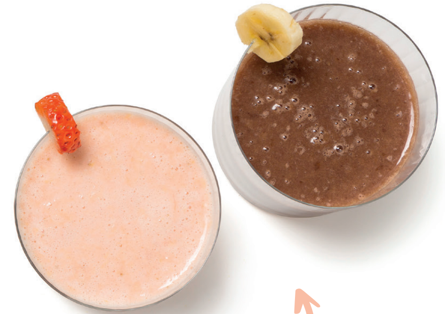
Batidos de fresa y naranja / plátano y cacao

Triturar 100g de fresas, 100g de naranja y 100ml de leche desnatada. / Triturar 140g de plátano, 150ml de leche desnatada y 2g de cacao puro en polvo desgrasado.