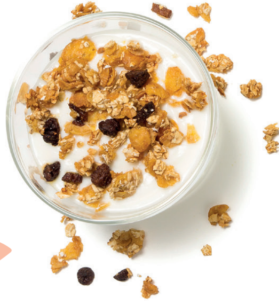
Granola (20g) y 1 yogur desnatado

Mezclar 50g de copos de avena, 30g de copos de maíz, 30g de arroz inflado, 10g de pasas, 10g de orejones y 50g de clara de huevo, dejar reposar 5', extender en una bandeja y hornear 10-12' a 160°C.